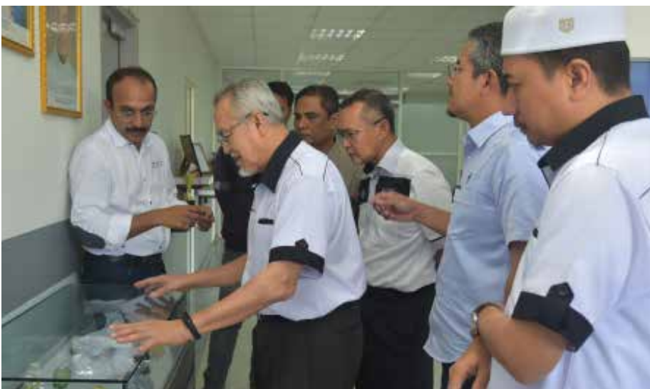
Dato' Tengku Hassan (dua dari kiri) melihat produk yang dihasilkan dari silika di Bari Setiu.

“Ianya akan membuka peluang pekerjaan kepada anak Terengganu dan sekali gus dapat merealisasikan usaha kerajaan menunaikan manifesto iaitu menyediakan 20,000 peluang pekerjaan dalam masa empat tahun,” ujarnya.