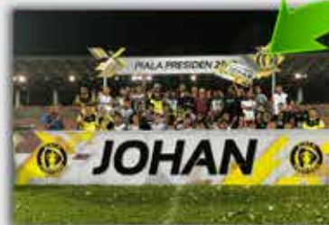
TFC III berjaya merangkul juara apabila mengatasi Kedah 2-1 pada perlawanan akhir Piala Presiden 2018 di Stadium Bola Sepak Kuala Lumpur, Cheras.

Pasukan Terengganu menyandang naib juara Piala Emas Raja-Raja (PERR) Ke-78 selepas tewas tipis 0-1 kepada Pahang.