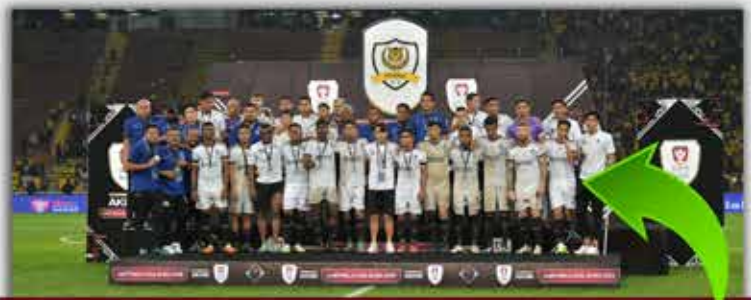
Pasukan TFC I terpaksa akur dengan keputusan 4-1 yang memihak kepada Perak pada perlawanan final Piala Malaysia 2018.

Terengganu turut meneruskan rentak kecemerlangan dalam rebutan Piala Emas Raja-Raja (PERR) Ke-78 dan layak ke final menentang skuad Pahang, namun dinafikan pasukan jiran dengan keputusan 1-0 di Stadium Majlis Perbandaran Temerloh, pada aksi 21 Oktober lalu untuk membawa pulang status naib juara.