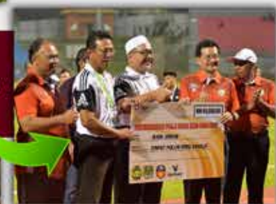
Pengurusan dan pasukan TFC II meraikan kejuaraan sulung Piala Cabaran 2018 di Stadium Sultan Ismail Nasirudin Shah Kuala Terengganu.

Pasukan Terengganu menyandang naib juara Piala Emas Raja-Raja (PERR) Ke-78 selepas tewas tipis 0-1 kepada Pahang.